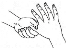
图A.5 大拇指在掌心旋转揉搓