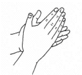
图A.1 掌心相对，手指并拢相互揉搓