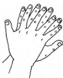
图A.2 手心对手背沿指缝相互揉搓